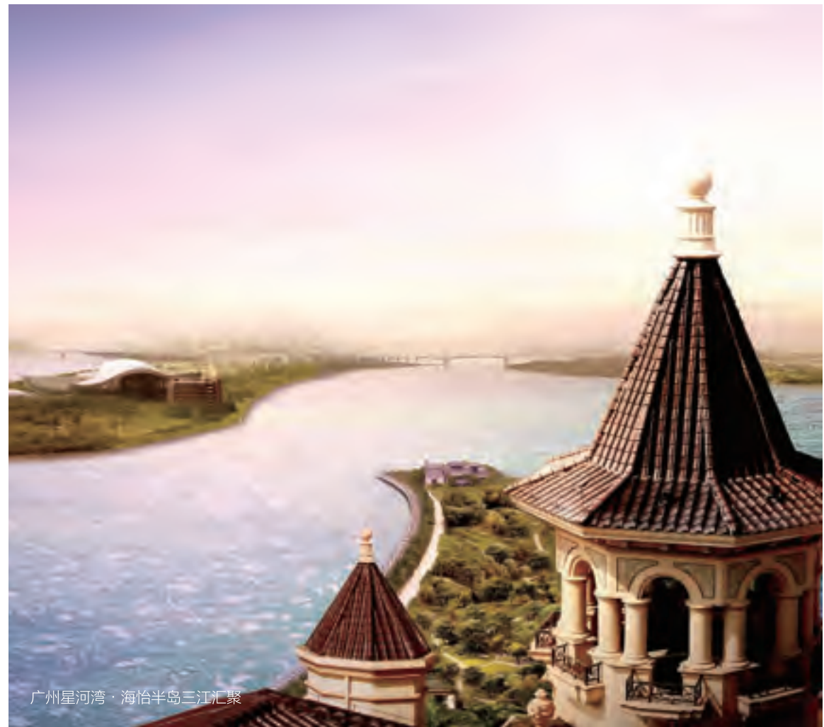
广州星河湾·海怡半岛三江汇聚