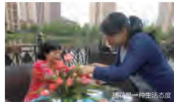
插花是一种生活态度