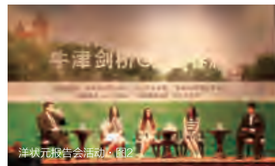
洋状元报告会活动·图2