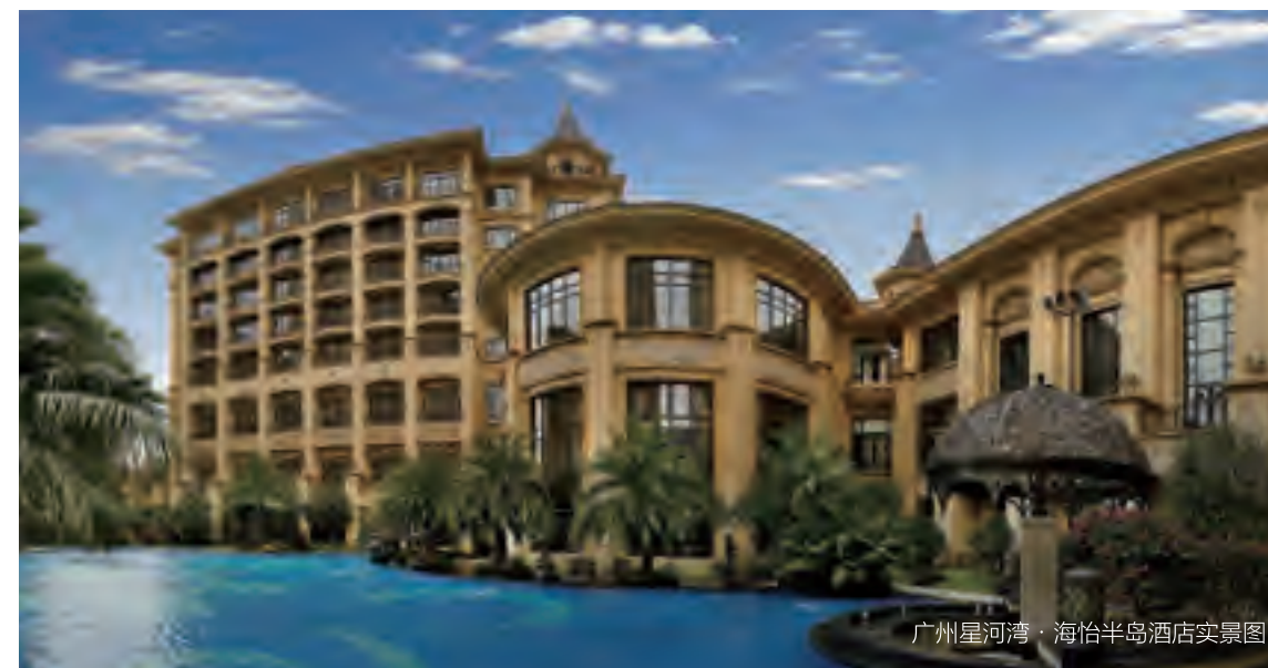
广州星河湾·海怡半岛酒店实景图