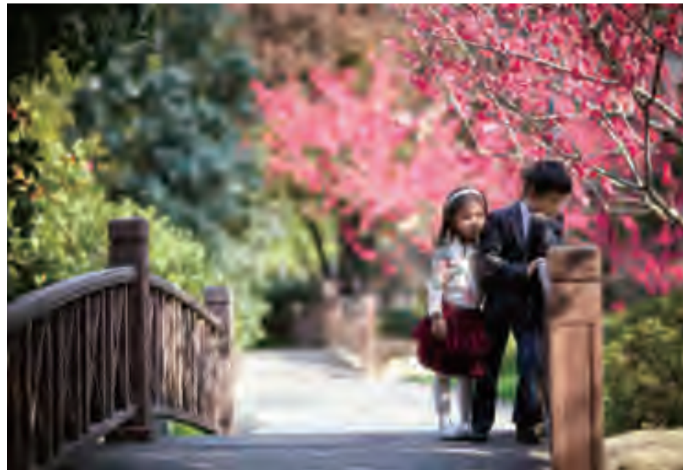
“最美星印象”专业摄影一等奖：那些年我们一起追忆的春天—浦东星河湾—陆宁