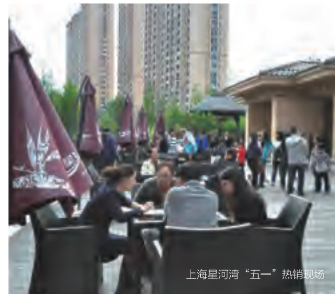
上海星河湾“五一”热销现场

2014年开年伊始，上海星河湾率先发力，以开春热销12亿的业绩成为上海楼市的明星楼盘。今年的市场扑朔迷离，但上海星河湾依然交出漂亮的成绩单，3天劲销近3亿，用极具说服力的数据体现了星河湾的品牌魅力以及高品质价值。5.1期间上海星河湾营销中心现场熙熙攘攘，热闹非凡。众多意向客户均表示自己是认准和追随星河湾品牌的忠实客户，上海星河湾超高品质以及未来成长的巨大价值更是令购房者心动所在。