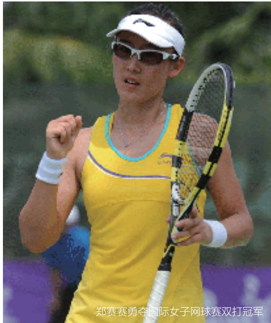
郑赛赛勇夺国际女子网球赛双打冠军

星河湾不仅致力成为“优质生活方式的创领者”，而且积极承担社会责任。星河湾职业网球俱乐部开创中国企业职业网球俱乐部的先河，以“舍得、用心、创新”的理念打造无坚不摧的网球职业团队，让更多球员能够站在国际大赛的领奖台上。