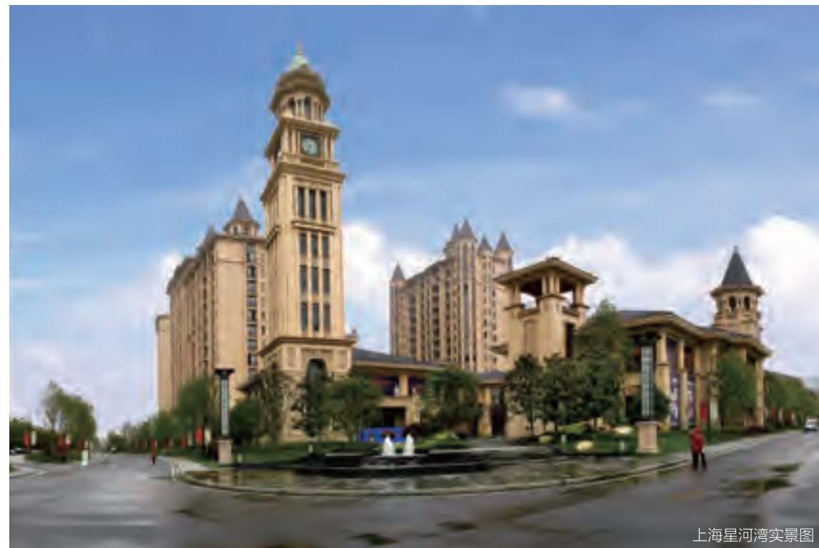
上海星河湾实景图

5月3日，上海星河湾还举办了“悠赏春韵·醉美星河”游园活动。臻美园林里，鉴满园花开，赏春树新芽。此次活动更有优雅美丽的外籍真人“花仙子”现场为小朋友带来缤纷心情，引得小朋友纷纷留影纪念。