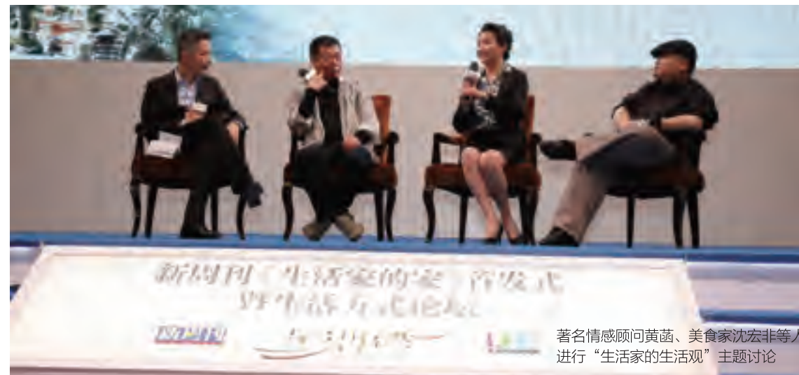
著名情感顾问黄菡、美食家沈宏非等人进行“生活家的生活观”主题讨论