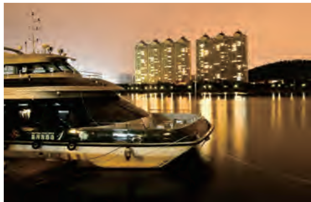
“最美星印象”专业摄影一等奖：夜色下的星河湾码头—广州海怡—王缉珠