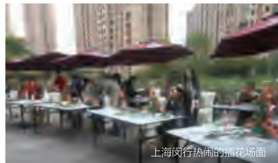
上海闵行热闹的插花场面

浦东星河湾：结合浦东星河湾项目实际情况，于4月20日上午举办了周日专场“趣味花谜”社区文化活动。以“花”为主题的谜面彩纸一排排挂在彩带上，业主们踊跃参加，赢得了丰富精美的奖品。