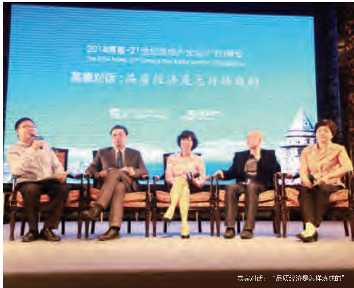
嘉宾对话：“品质经济是怎样炼成的”