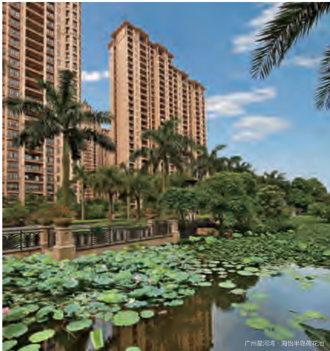
广州星河湾·海怡半岛荷花池