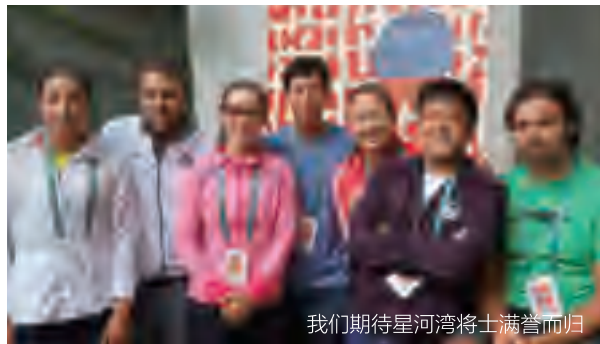
我们期待星河湾将士满誉而归

这是中国第一家职业网球俱乐部首次出征世界网球四大满贯赛场，俱乐部共派出球员、教练近10名，这在中国网球历史上也属首次。