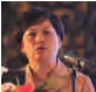
秦虹 / QINHONG

中华人民共和国住房和城乡建设部政策研究中心主任，研究员，兼任中国社会科学院研究生院城乡建设经济系副主任、教授；国务院颁发政府特殊津贴的专家，自1988年起从事城市建设投融资、住房与房地产政策与理论研究工作。在城乡建设研究领域富有经验并具广泛影响。