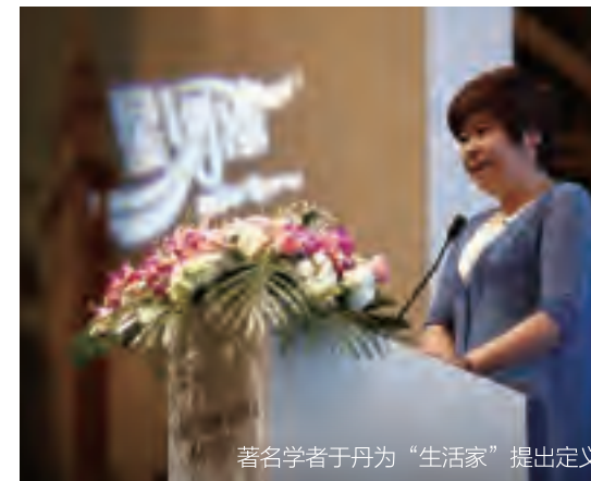
著名学者于丹为“生活家”提出定义

本期《四季》的星专题选载了第418期《新周刊》陈旧的《星河湾生活方式研究院》、肖锋的《星河湾董事长黄文仔专访——懂生活才能懂房子》、朱慧憬的《谢有顺：心若嘈杂，在哪儿都不能安静》，其中，《新周刊》对“星河湾生活方式”三个层面的解读与归总，对星河湾黄文仔董事长、星河湾业主谢有顺的专访，从不同侧面呈现星河湾的生活家及生活家的家。