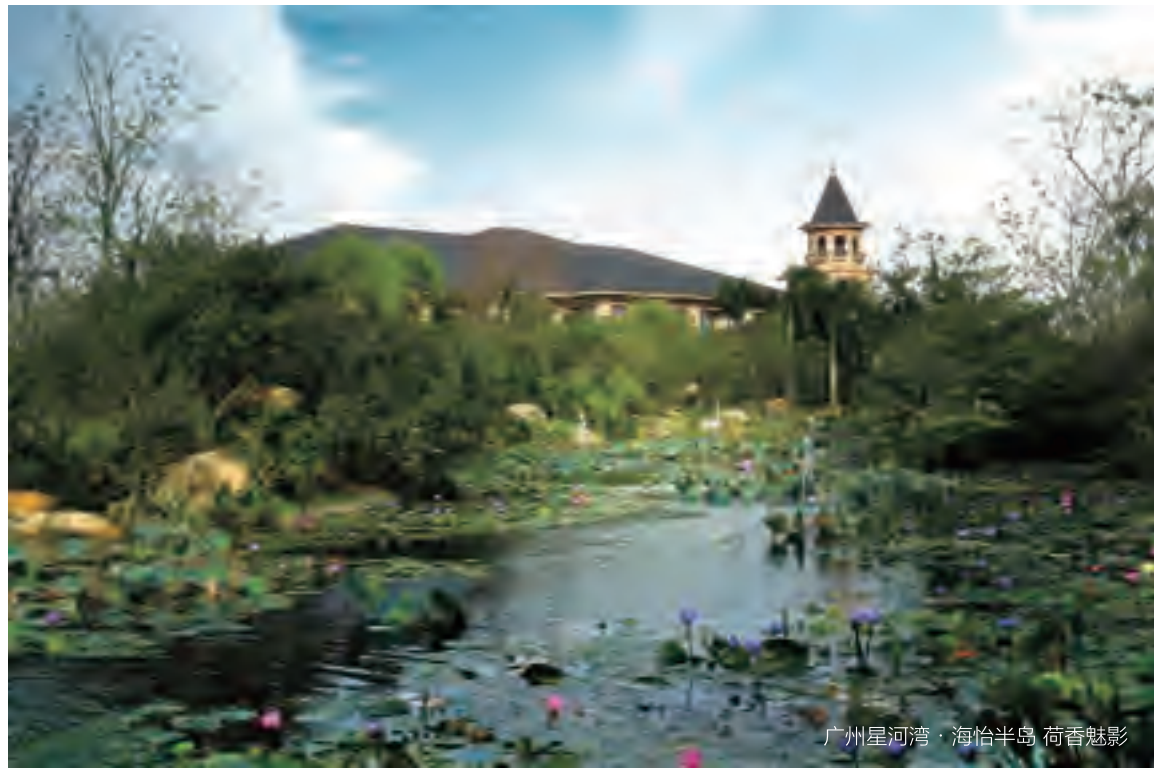
广州星河湾·海怡半岛 荷香魅影