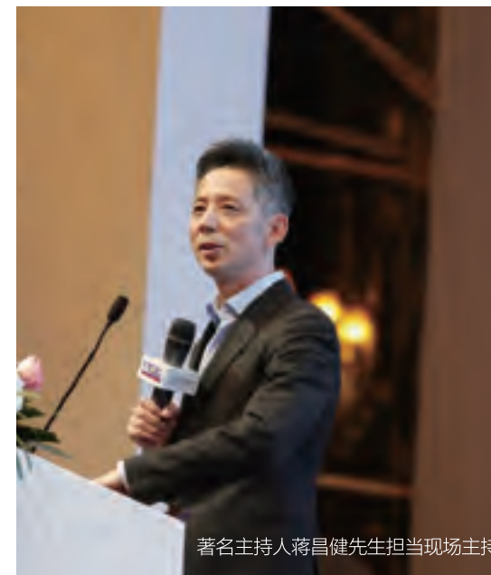
著名主持人蒋昌健先生担当现场主持