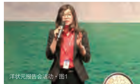
洋状元报告会活动·图1

一直以来，星河湾集团秉承“做优质生活方式的创领者”的愿景，在为业主家庭提供高品质居住环境的同时，不遗余力地支持业主下一代的教育，将高端优秀的教育资源引进社区，帮助业主提前规划好孩子的未来。“胡润百富榜”创办人胡润先生在参观星河湾后曾赞叹道：“在西方国家，培养出真正的贵族需要三代人，但在星河湾，时间被缩短了一半。”在星河湾成长的孩子不仅仅是一个品学兼优的学生、更重要是具有国际视野的“世界公民”。