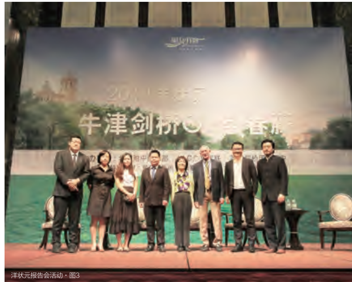
洋状元报告会活动·图3