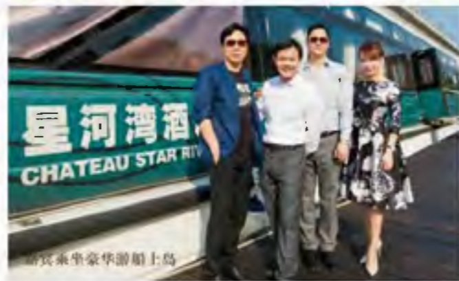
嘉宾乘坐豪华游船上岛