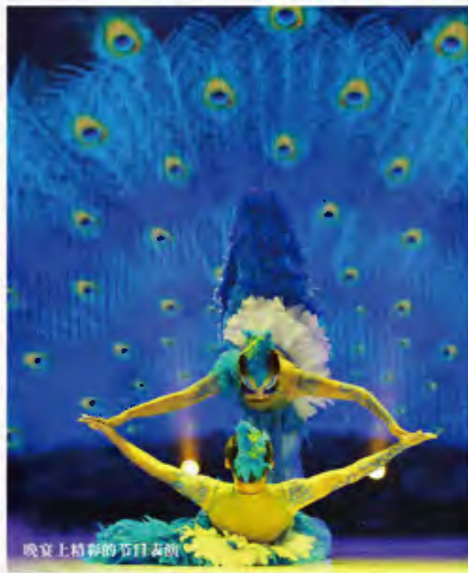
晚宴上精彩的节目表演