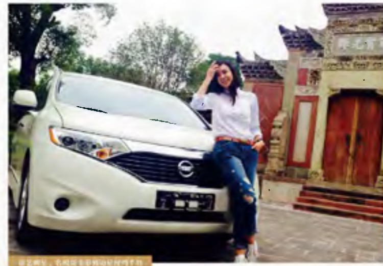
周韦彤，名模造访星河湾半岛

香港著名演员蔡少芬也在12月10日来到星河湾半岛，以星河湾半岛优美的园林及建筑作为背景，拍摄了时尚大片。星河湾半岛的景致给蔡少芬留下深刻的印象，表示非常喜欢这里的环境。