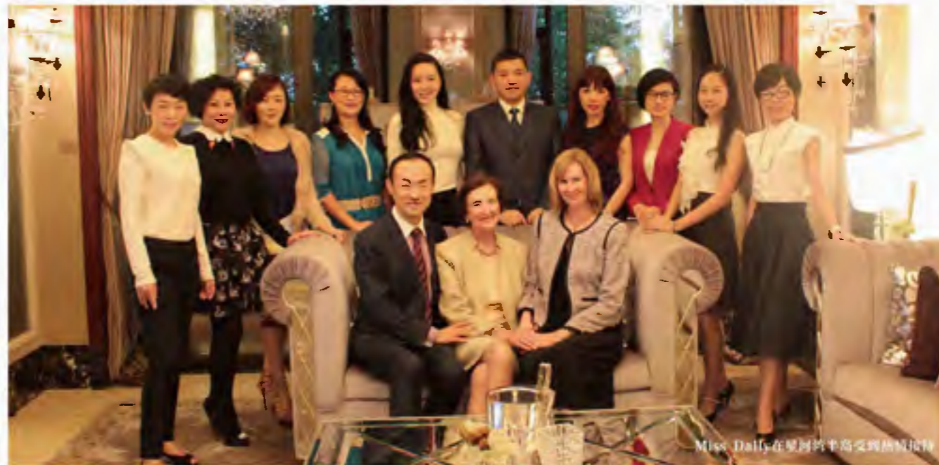
Miss Dally在星河湾半岛受到热烈欢迎