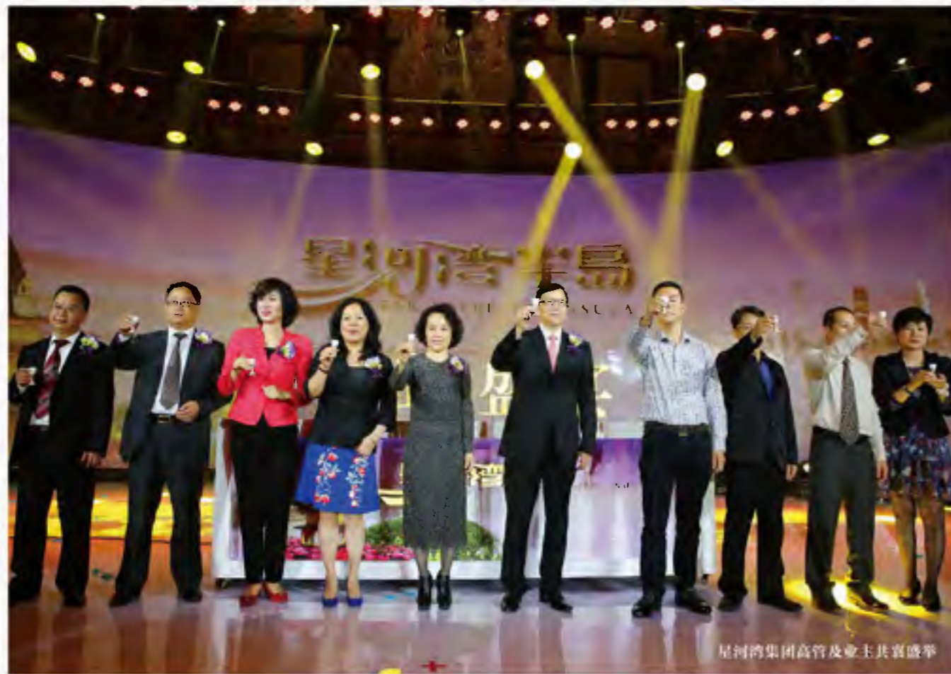
星河湾集团高管及业主共襄盛举