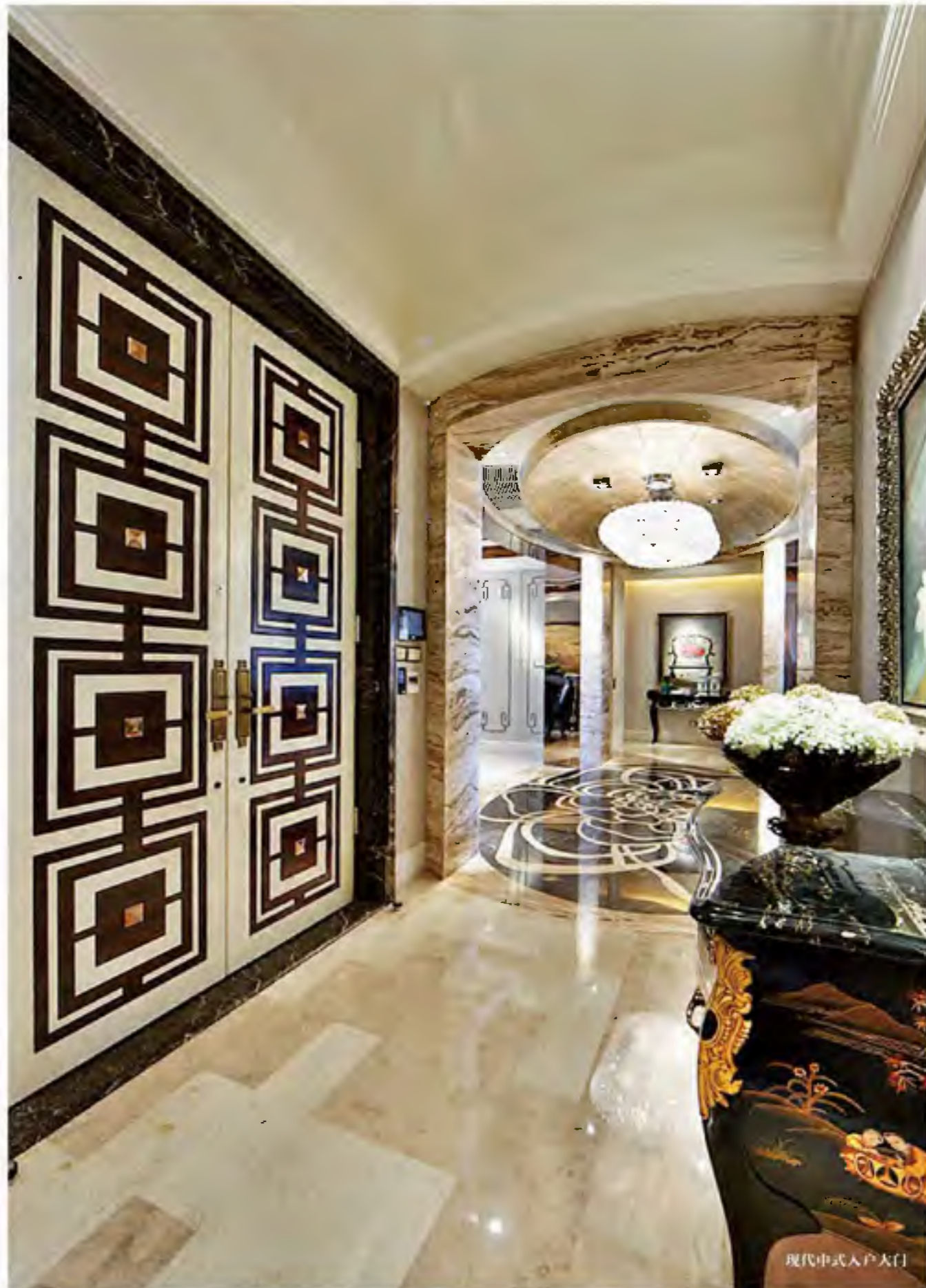
现代中式入户大门

“星河湾装修风格之变，正是我们对客户的洞察在产品上的体现”，星河湾负责人介绍说，过去星河湾的忠实客户都认为经典版的金碧辉煌才是“高品质住宅正道”。如今，财智人群对居住空间的要求也在发生着变化，色调要求更淡雅、线条要求更简洁、更注重空间的柔和度。正是基于这一背景，星河湾半岛“岛尖”演绎出全新装修风格，推出中国星河湾高品质住宅系列的升级力作。