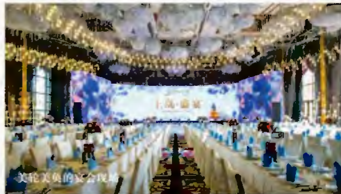
美轮美奂的宴会现场