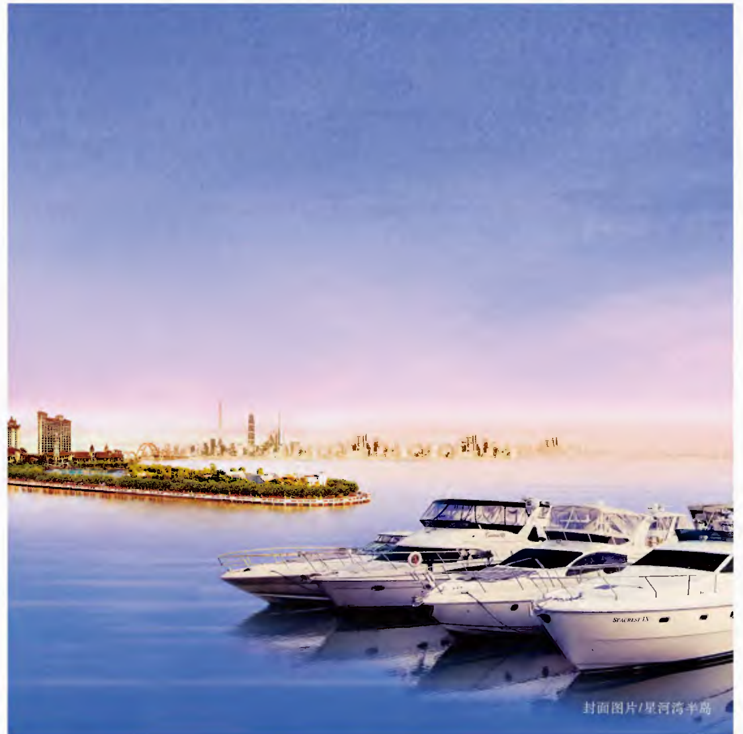
封面图片/星河湾半岛