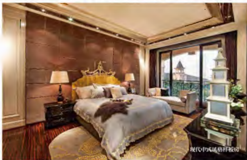
现代中式风格样板房

“创新”，当然不是空穴来风、无本之木。星河湾的“全新升级”，其“用心”处就在于，体察高净值人群居住及审美的新诉求。